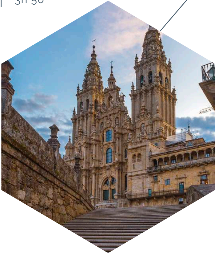
Catedral de Santiago de Compostela