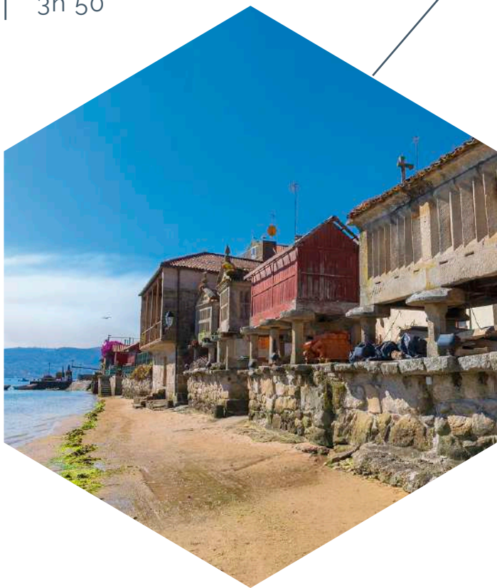
Pueblo pesquero de Combarro, Poio, Pontevedra