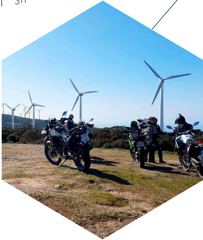
Vista eólicos, Barbanza