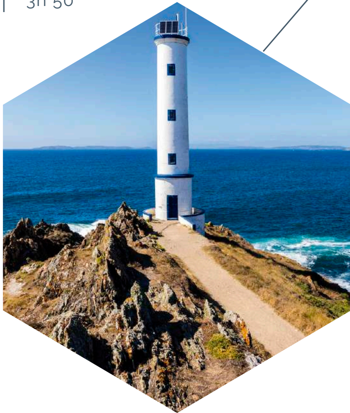
Faro Cabo Home, Cangas, Pontevedra