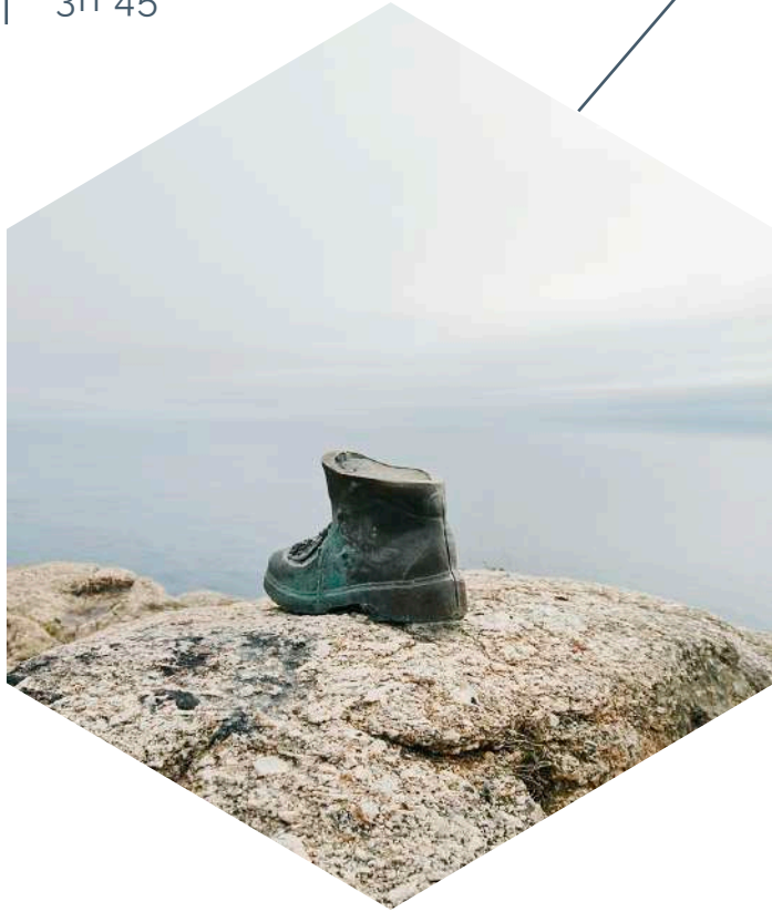
Vista de La Bota del Peregrino, Cabo Finisterre